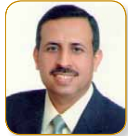
الدكتور فوزي الحموري نائب الرئيس