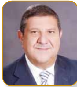
السيد جمال فريز الرئيس